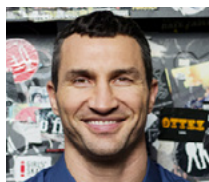
Dr. Wladimir Klitschko

Gründerin von Amorelie, Verwaltungsrätin bei Conrad SE und Jury-Mitglied bei der TV-Show „Das Ding des Jahres“